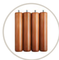
CEREZO / CHERRY