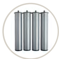
TAPI / TAPI