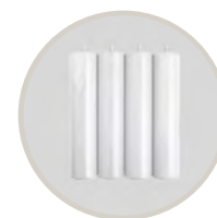
BLANCO / WHITE