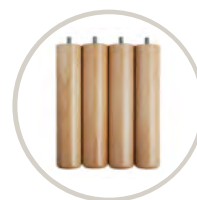
NATURAL / NATURAL