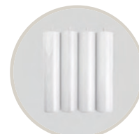
BLANCO / WHITE