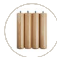
NATURAL / NATURAL