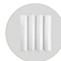
BLANCO / WHITE