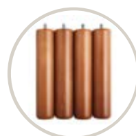
CEREZO / CHERRY