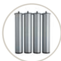
TAPI / TAPI