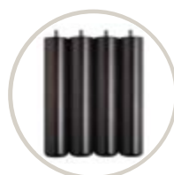
WENGUE / WENGE