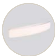
BLANCO / WHITE