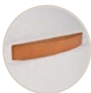
CEREZO / CHERRY