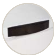
WENGUE / WENGE