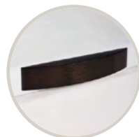
WENGUE / WENGE