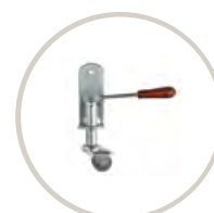
RUEDA / CASTOR 86 PUNTOS / 86 POINTS

Tapa reforzada con 4 travesaños horizontales. Reinforced cover with 4 horizontal slats.