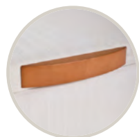
CEREZO / CHERRY