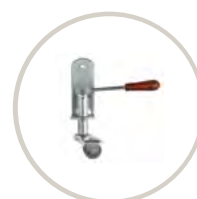
RUEDA / CASTOR 86 PUNTOS / 86 POINTS

Tapa reforzada con 4 travesaños horizontales. Reinforced cover with 4 horizontal slats.