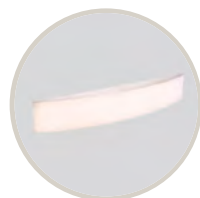
BLANCO / WHITE